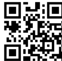
購買部ウェブストア

② キャンパスストア・タマガワで購入 (電話 042-739-8945) 地図は裏面参照。営業時間は、平日 8:30~18:30、土 10:00~16:00 です。 お支払には現金・クレジットカード・交通系 ICカードが使えます。